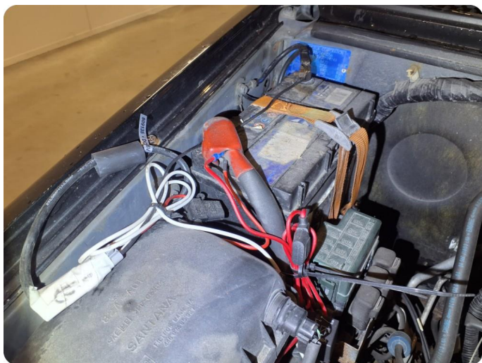
3.1 Startbatteri - defekt kabelfeste