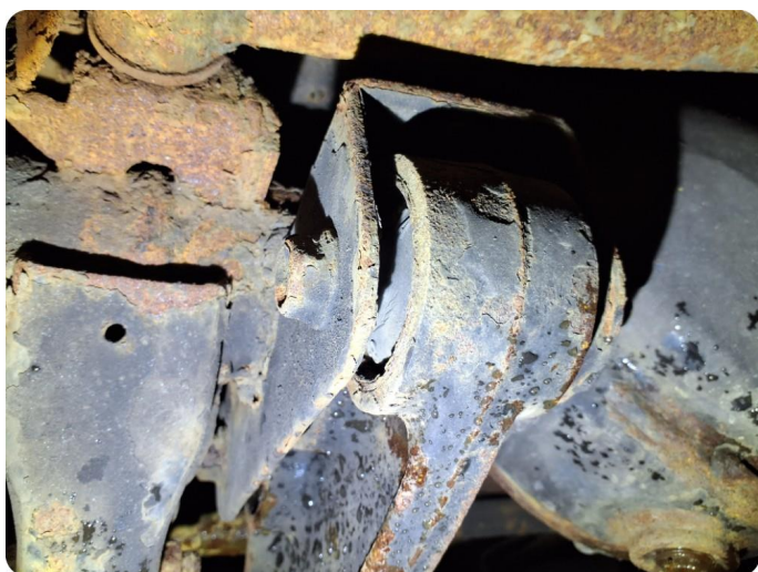
4.2 Slitt bærebøring