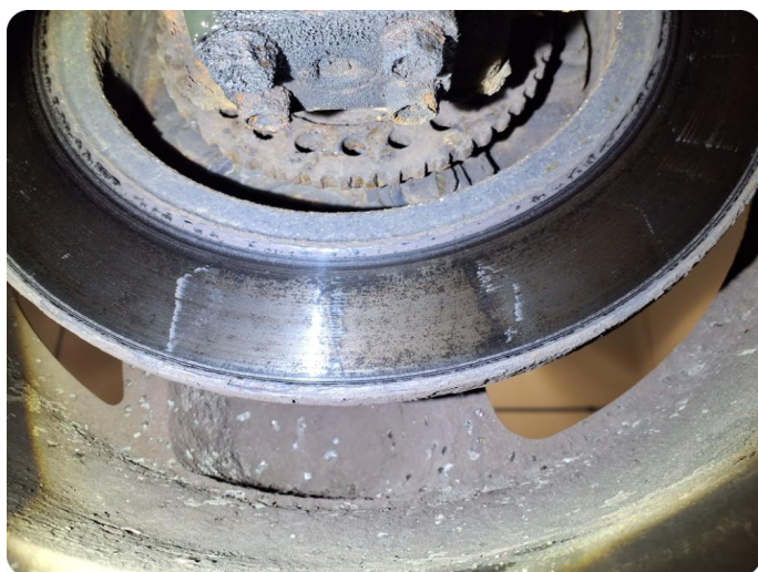
5.2 Slitte/stor slitekant