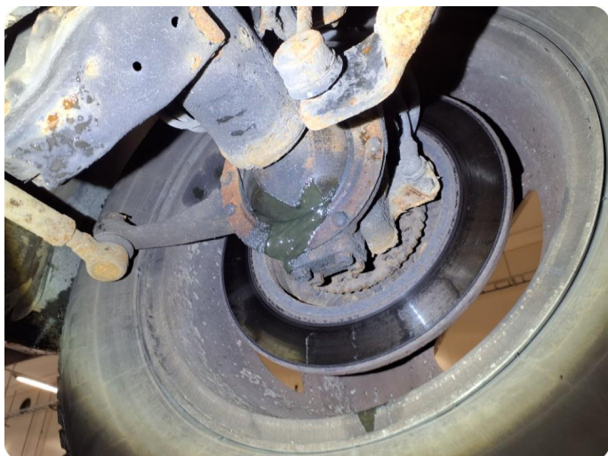
6.2 Drivakselmansjett defekt Lekkasje