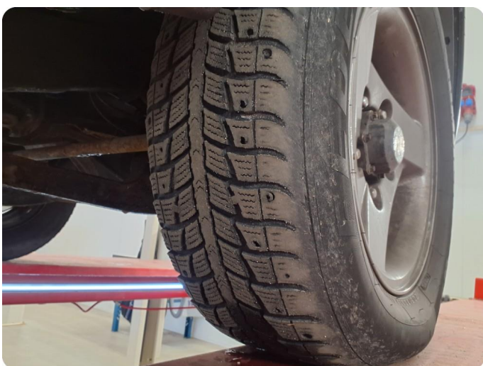
2.3 Piggdekk mangler pigger