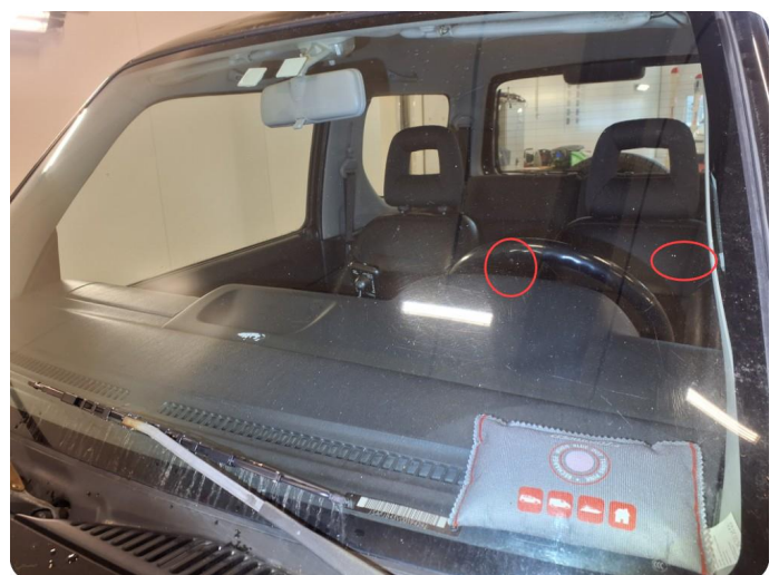
2.4 Steinsprut i synsfelt